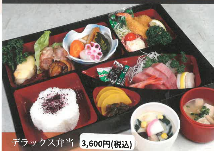
デラックス弁当 3,600円(税込)

お弁当、日替わりランチ、イベントや会議用のお弁当、 慶弔法事用の折り詰めやオードブルなど、 「食」と「集い」に応じたメニューをご用意しております。 厳選食材を丁寧に調理し、心を込めてお届けいたします。