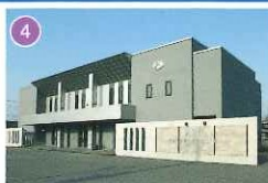
アピオキャピタルセレモニーホール