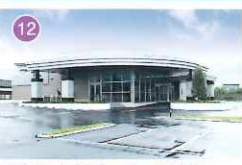
アピオセレモニーホール山梨