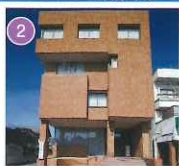
アピオ機山ホール