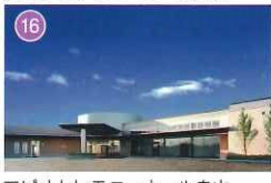
アピオセレモニーホール舟山