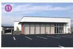
アピオセレモニーホール八代