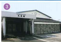
アピオセレモニーホール天昇殿