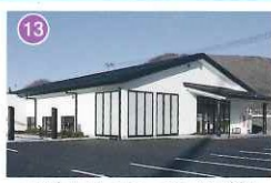
アピオセレモニーホール身延