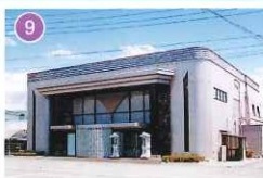
アピオセレモニーホール巨摩