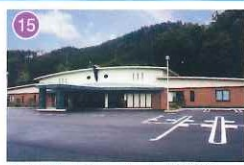
アピオセレモニーホール大月斎場