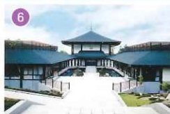
アピオセレモニーホール甲府北