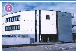
アピオセレモニーホール甲府