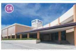
アピオプラザ都留