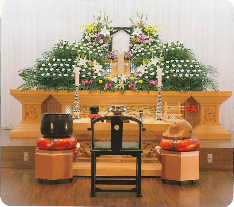
*但し、施行時に消費税相当額をお預かり致します。

月掛金 3,000円×120回 → 360,000円 非会員価格 550,000円セット 会員は190,000円お得です。