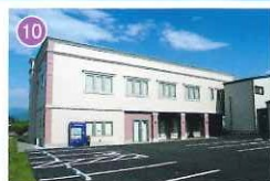
アピオセレモニーホール南西