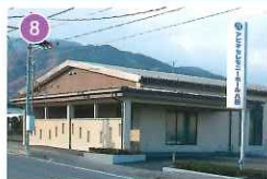
アピオセレモニーホール八田