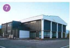
アピオセレモニーホール田富