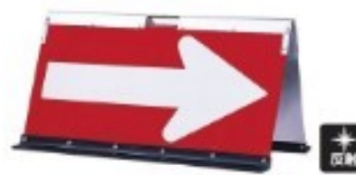
山型アルミ矢印板 把手付