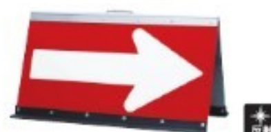
アルミ製 折タタミ矢印板 把手付