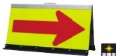
折タタミ矢印板 黄/赤 把手付