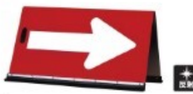
公団型矢印板 RC-04 把手付