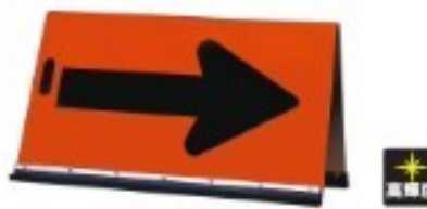
HY矢印板 HY-1 把手付