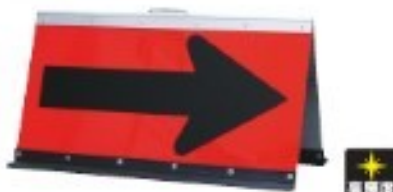
折タタミ矢印板 橙/黒 把手付