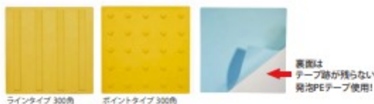
仮設専用点字パネル