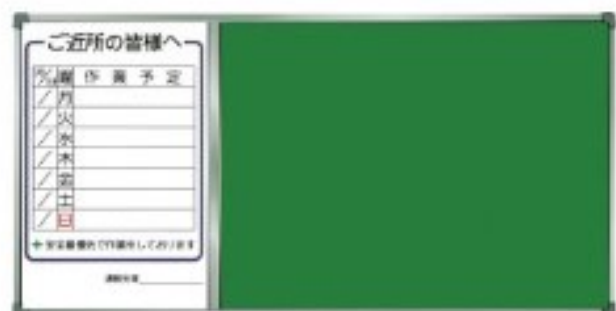
作業予定表(掲示板付き) A-3W