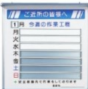
安全掲示板 OK-40(作業予定表)