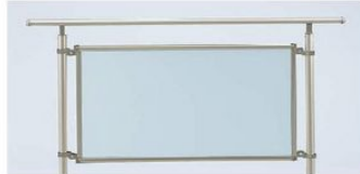
5型(自立タイプ)(ポリカーボネートパネル) 水平地専用