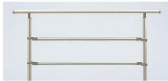
2型(自立タイプ)(横格子タイプ)