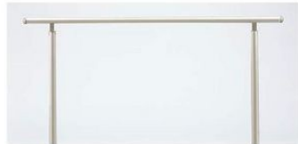
1型(自立タイプ)(笠木のみタイプ)