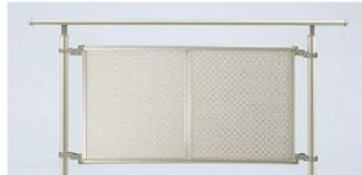
4型(自立タイプ)(パンチングパネル) 水平地専用