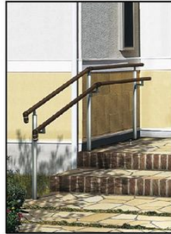
パルトナーUD フェンス1型(笠木円形) T80 2段笠木仕様/端部アールキャップ1型付き