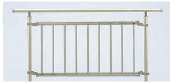
3型(自立タイプ)(たて格子タイプ)