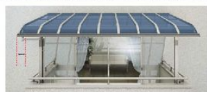
張り出しありタイプ