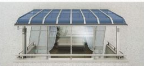
張り出しなしタイプ

“張り出しなし”と“張り出しあり”の2タイプから選べます。バルコニーへの雨や雪の吹き込みが気になる場合“張り出しあり”がおすすめです。