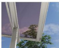
2C: スモークブラウン