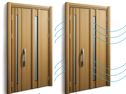
通風なし ← 同デザイン → 通風ドア D4加算額+¥80,000 D2加算額+¥100,000

ドアを閉めたまま、内開き通風機構を開くだけで、部屋の中を換気するのに 十分な通風面積が得られます。通風部は侵入防止に有効なサイズとし、 防犯にも配慮しました。