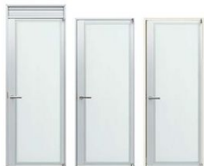
アルミ枠 (ピボット) 通風機能付