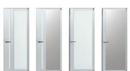
通風枠タイプ T1: 採光パネル