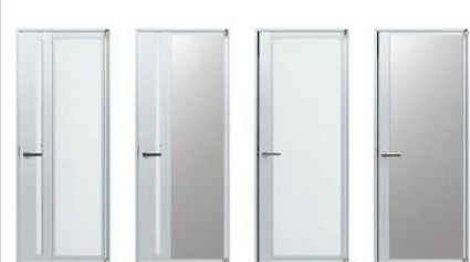
通風枠タイプ T1: 採光パネル