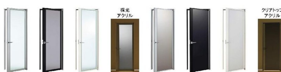
ピアマットシルバー ガラスカラーマット調