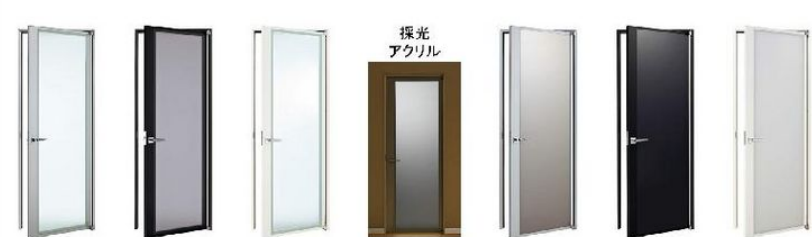
ピアマットシルバー ガラスカラーマット調