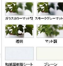
ガラスカラーマット調 スモークグレーマット調