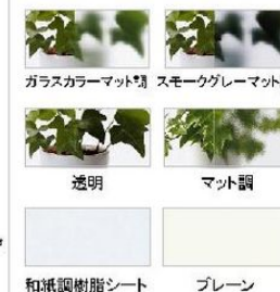
ガラスカラーマット調 スモークグレーマット調