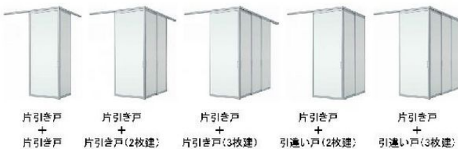
片引き戸 + 片引き戸 片引き戸 + 片引き戸(2枚建) 片引き戸 + 片引き戸(3枚建) 片引き戸 + 引違い戸(2枚建) 片引き戸 + 引違い戸(3枚建)