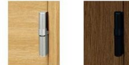
マットシルバー マットブラック(特注対応)