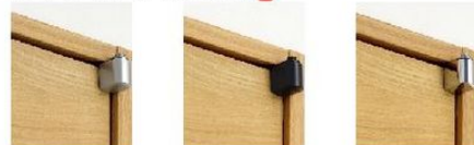
マットシルバー マットブラック(特注対応) クロムメッキ(特注対応)

デザイン性に優れ、3次元調整可能なピボットヒンジを標準採用。3方向への調整も容易に行えます。