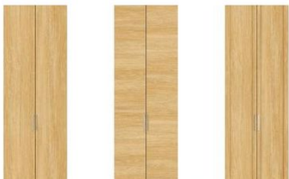
T デザイン (フラット木目たて) Y デザイン (フラット木目横) J デザイン (二方框風) K デザイン (鏡面仕上げ)

Yデザイン ※隣合う扉で横柄は揃いません。 Kデザイン ※扉全面の光沢感を高めると、凹凸仕上げ で足跡が残りやすくなります。 ※扉色はホワイトのみ。ボックス色は プレーンになります。 ※W07・W11の設定はありません。