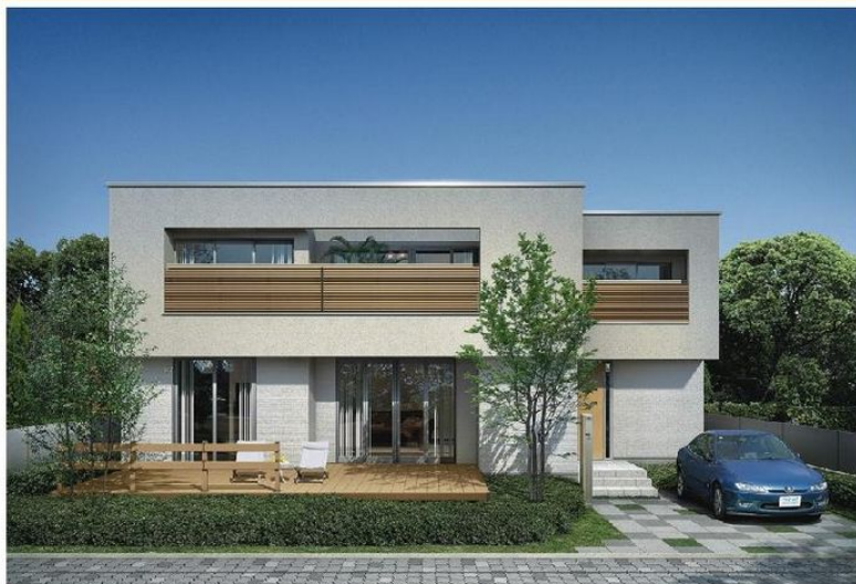
ホワイトブラウン/リウッドデッキフェンス 4型/レグザ機能門柱 1型