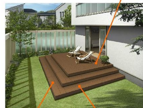
正面段床部 (上記写真は2段)