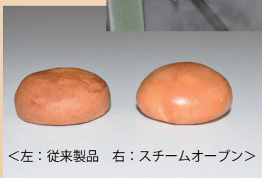
<左：従来製品 右：スチームオープン>

(当社テストの一例) 同じ原料で焼成された小饅頭。 右が当社スチームオープンを使用。 色つやが良く、ふっくらと仕上がりが、 個別包装資材への表皮付着がありません。