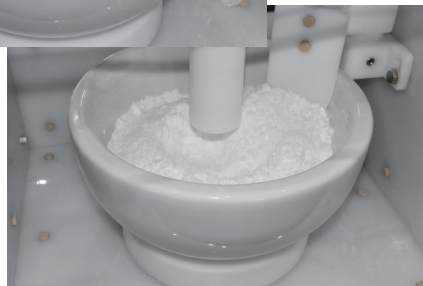
バキュームによる乳鉢固定