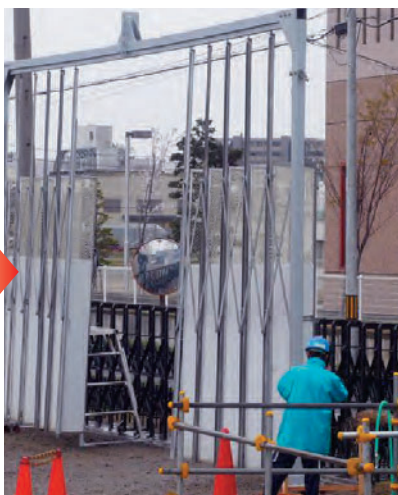
スパイク工法により完成