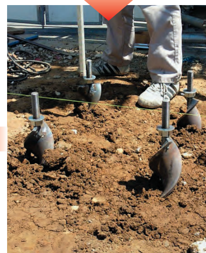
スパイク打ち込み完了