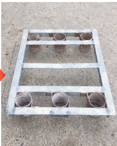
スパイク4本打ち込み