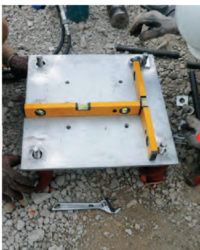
プレートのレベルをとる