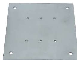
ベースプレート 単重: 25kg