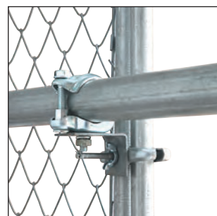
単管連結クランプ