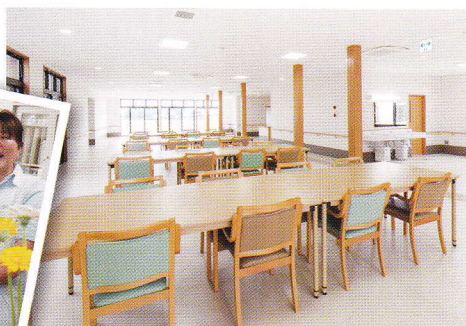
▲ゆったり広々とした食堂