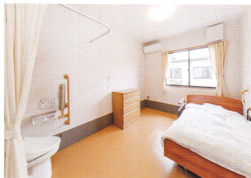
▲充実した設備で、快適な自分らしい住空間を。