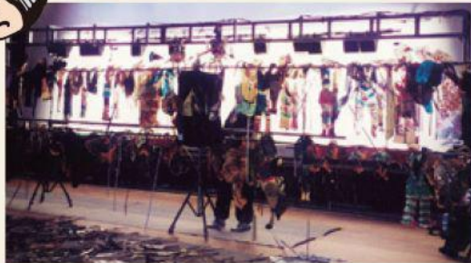
※公演終了後、不思議な世界のバックステージ見学あり。(影絵の仕組みをのぞいちゃおう!)