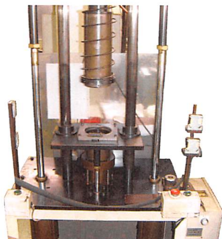
簡易型のレーシング前仮整形機