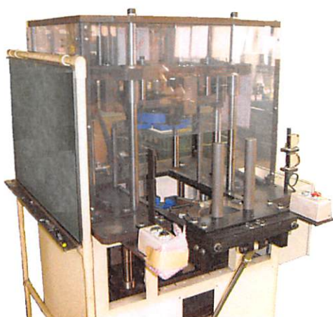
大型ワーク用仕上整形機