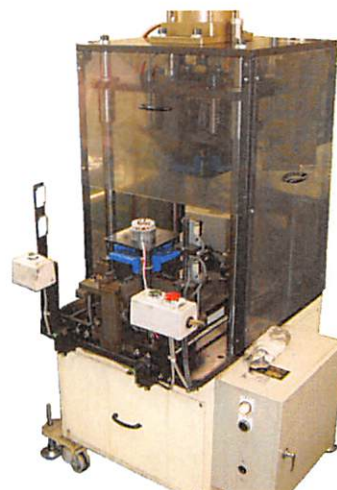
小型ステーターに適した仕上整形機