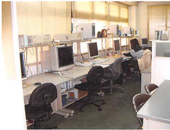
(弊社設計室 AUTO CAD 3台使用)

基本的な各種機械の図面は既に完成しております。その基本図面を元に弊社設計部がお客様の要望、条件及び各種ステーター仕様を考慮して一台一台設計を行います。