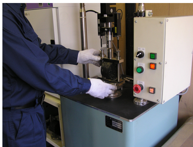
アスファルト合材品質管理試験作業風景