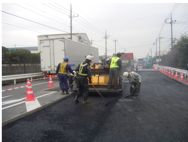
舗装施工現場作業風景

再生アスファルトコンクリート合材をメインに製造販売しており、30年以上にわたりアスファルト舗装のリサイクルに貢献しています。弊社の再生アスファルトコンクリート合材は再生骨材の使用率がおよそ70%になり、全国的にみても高いリサイクル率を誇ります。また、舗装道路に対する耐久性や長寿命性の要望に対応するために改質材と呼ばれるアスファルトの製造も行っています。