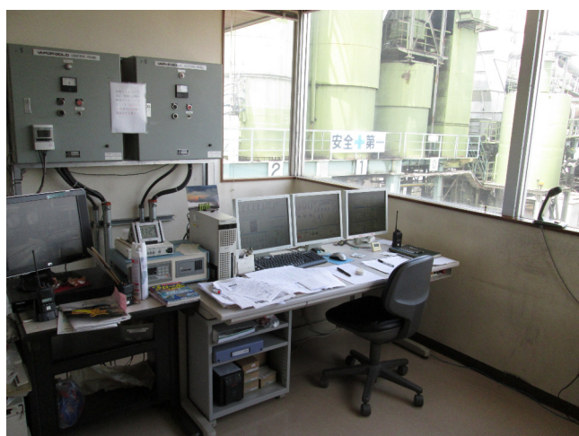
アスファルトプラント操作室

業務に必要な資格取得については会社でサポートしていますので未経験の方でも大丈夫です。