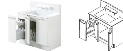
片引き出しタイプ (開口900mm)