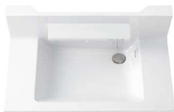
ボウル一体カウンター (実容量12L)