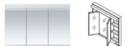
三面鏡 (ベーシックLED・エコミラー仕様・開口900mm)