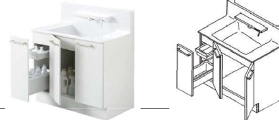
片引き出しタイプ (開口900mm)