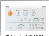
ウォシュレット用リモコン