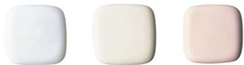
#NW1 ホワイト #SC1 パステルアイボリー #SR2 パステルピンク※