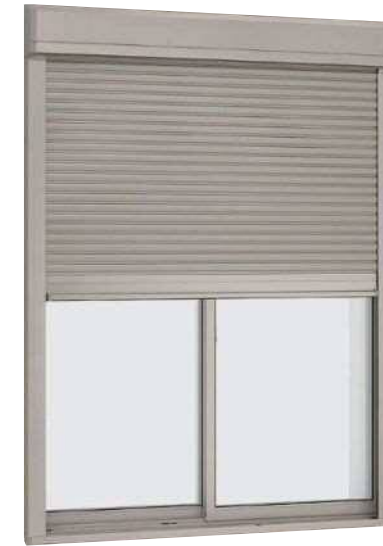
シャッター付引違い窓