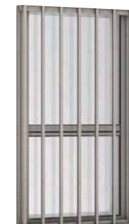
面格子付 上げ下げ窓 FFS