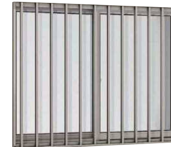
面格子付引違い窓