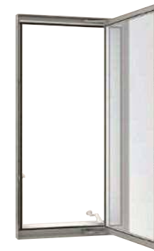
縦すべり出し窓 (オペレーター)