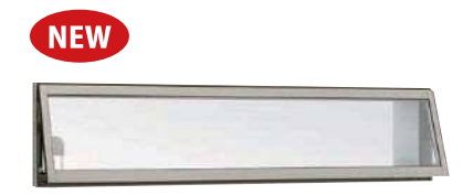
NEW 高所用横すべり出し窓