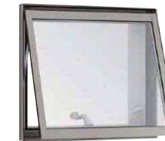
横すべり出し窓 (オペレーター)