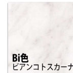
Bi色 ピアンコトスカーナ