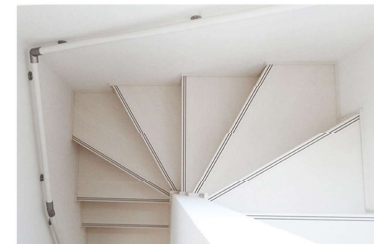
階段：MYW色（ブランクウォールナットホワイト）・丸棒手摺：866E