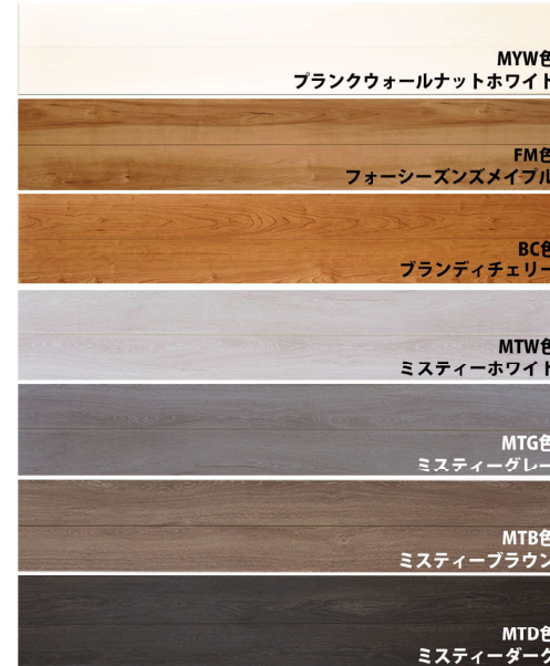
MYW色 ブランクウォールナットホワイト

森林資源を有効活用する 環境配慮型フローリング 日常生活で床材の受ける様々な傷の発生に対して 大幅にメンテナンスの手間も軽減します。