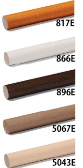
丸棒手摺の色柄は階段色に合わせた類似色を5色ご用意しております。