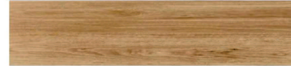
CP03 グレージュオーク柄