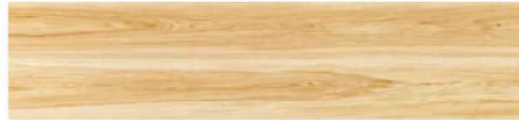
CP02 ナチュラルペカン柄