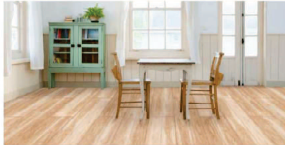
落ち着いた優しい色味が生活に癒しをもたらします。