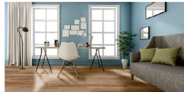
北欧の森や風を感じるようなモチーフやファブリックソファが引き立ちます。