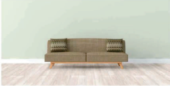
厳選した家具や小物に囲まれる暮らしには最適なデザインです。