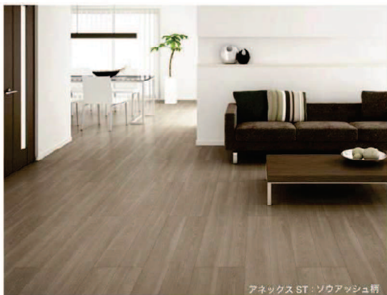
アネックスST：ソウアッシュ柄