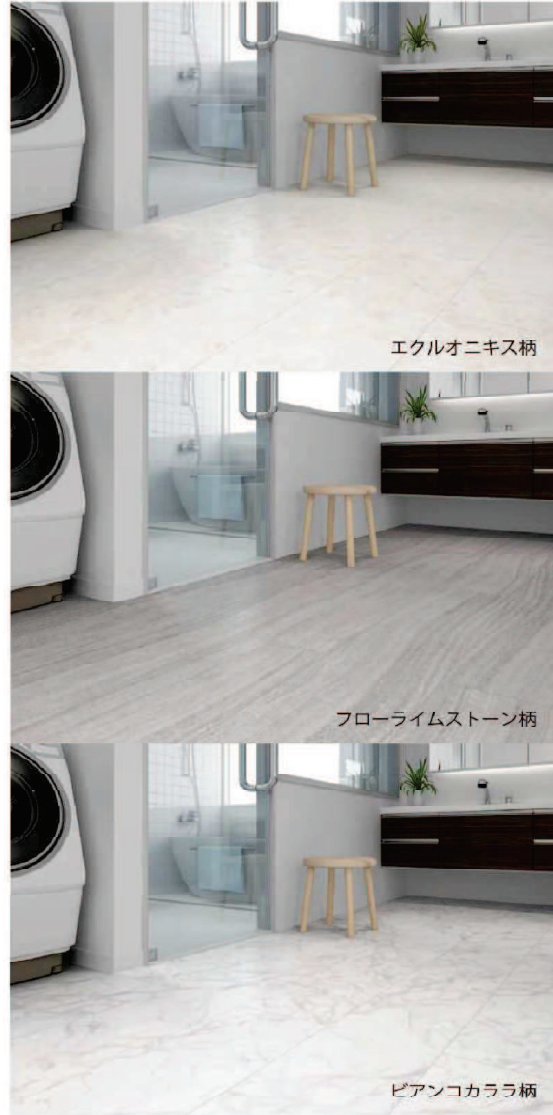
エクルオニキス柄