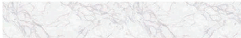
ピアンコカララ柄