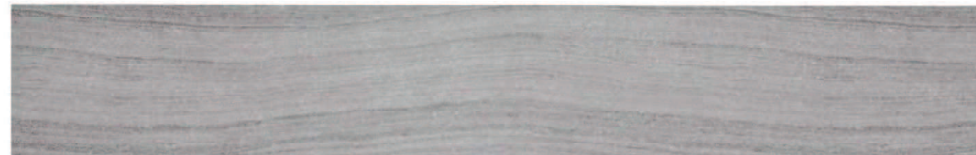
フローライムストーン柄