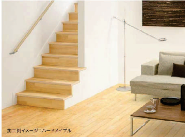
施工例イメージ：ハードメイプル