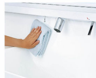
一体成形カウンターで お手入れ簡単。