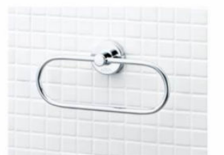
スタンダードシリーズ タオルリング KF-91A