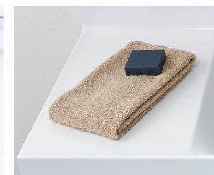
カウンターは 仮置きスペースにピッタリ。