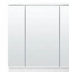
スリムLED照明・3面鏡・全収納 MEB-903TXJU