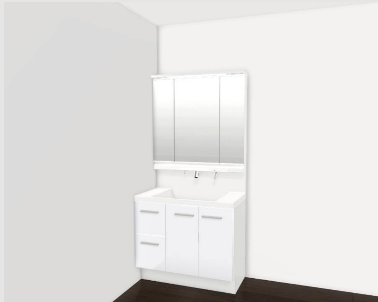
CG合成によるイメージ画像です。