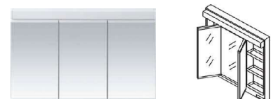
三面鏡 (ベーシックLED・エコミラー仕様・開口900mm)