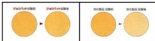
■耐候性試験(サンシェイヴェザー 1000時間)

ジョリパットは退色が非常に少ない材料を使用。 色あせが極めて少なく、いつまでも仕上がりの美しさを保ちます。