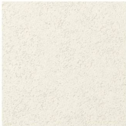
エンシェントブリック

<パターンバリエーション> 色は専用サカランプルよりご自由にお選びいただけます。全184色