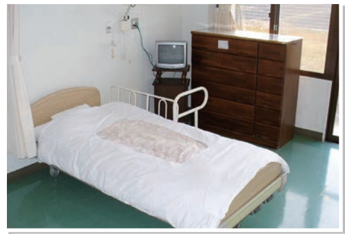
入所利用者 療養室