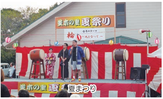
釜木の里夏まつり