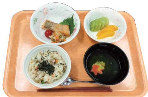
昼食のメニュー例