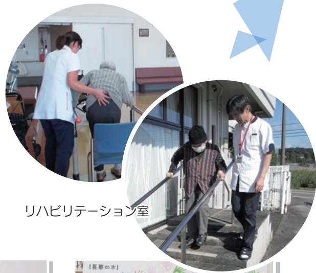
リハビリテーション室