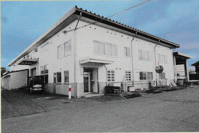
東北工場社屋 TOHOKU PLANT & OFFICE