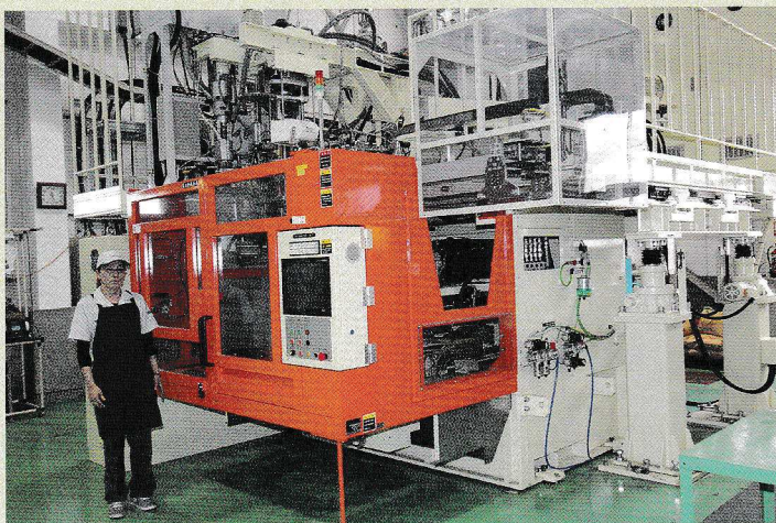
多層ブロー成形機