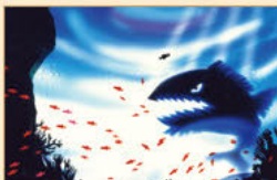
音楽物語 「西遊記」 人形の操作陣の影を無くした国際的な技術