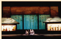
スーパーカグエ 「竹取物語」 日本一の大立立体影絵劇