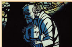
音楽物語 「三蔵経」 切り絵のデザインをその家生が考えた影絵人形