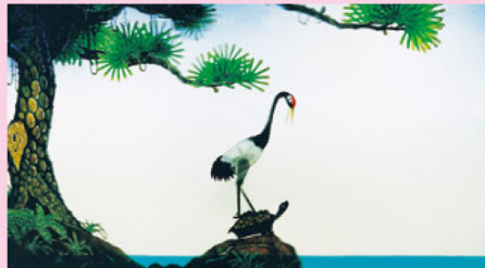
生きているような鶴と亀によるコミカルな寓話「鶴と亀」