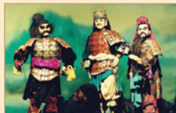
日中国際共同制作大人形劇 「三蔵経」 120cmを越える大人形たちが着せる壮大な歴史衣装