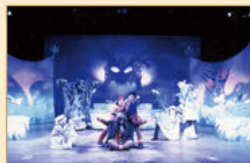
日本・北京4ヶ国国際共同制作 「三蔵経」 セットやスクリーンに布を巻かした舞台