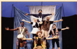
日本・東アフリカ国際共同制作 「アフリカの唄」 海外の音楽家と影絵のコラボレーション