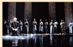
日本ASEAN5ヶ国国際共同制作ミュージカル 「ASEAN」 アジアの若手による舞台芸術の発掘!