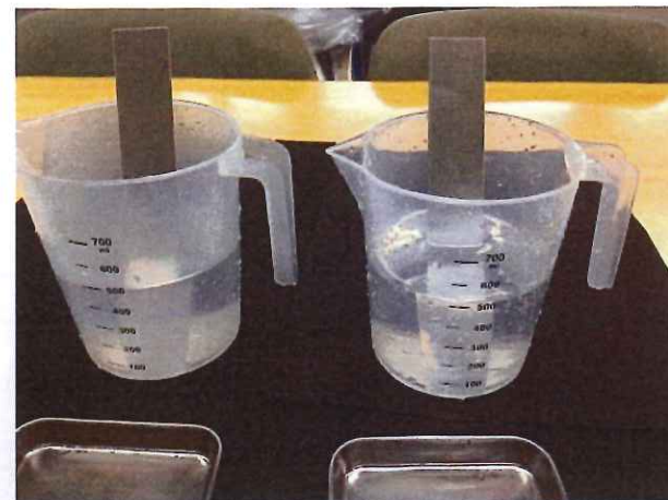
両者を同条件にてすすぎ