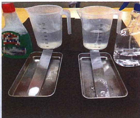
アルカリ洗剤(左)とイオン水(右)にそれぞれ滴下