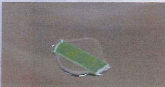
PH試験紙の色がアルカリの残留を示す。