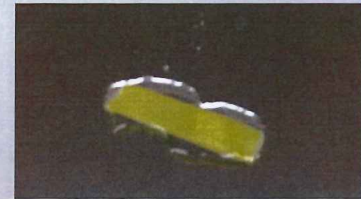
アルカリの残留はみとめられない。