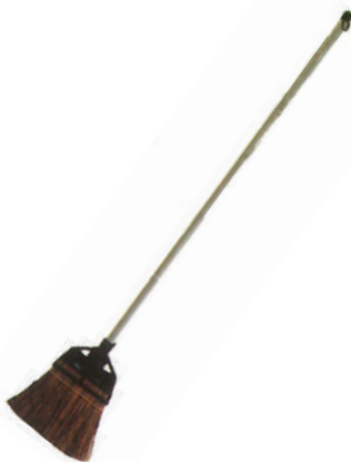
庭シダほうき長柄