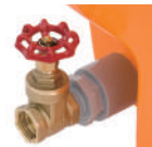
バルブ取付例 (ドレン)