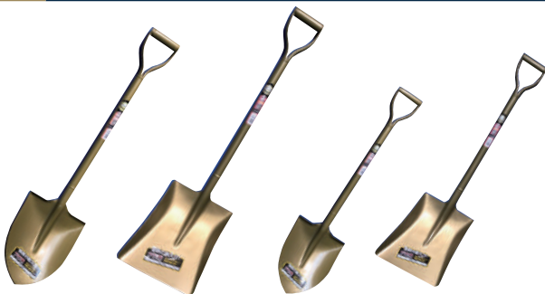
No.13285 剣スコップ (大)