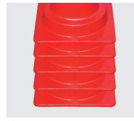
積み重ねて保管可能です。