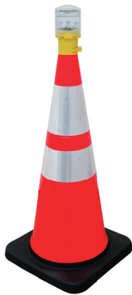
カットコーン 取付例