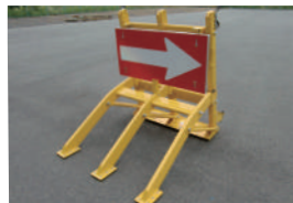
オプションで矢印板を取り付け可能です。