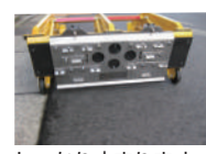
急な寒波にも対応可能 しっかり止まります。