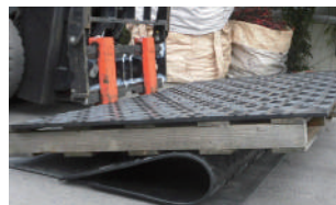
180°の曲げ試験でも割れません。