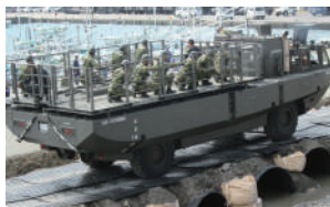
国土交、防衛省でも使われています。