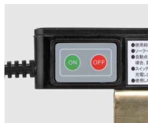
ON-OFF スwitchで 昼間に点灯チェックができます。