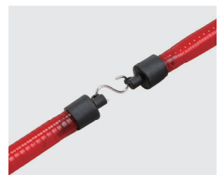
付属のSカンで連結が可能です。