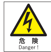
WK23 / WKS23 W130×H130mm