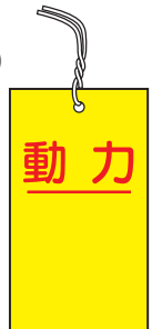
WK19 WK19(B)(無地) W40×H70×t0.5mm