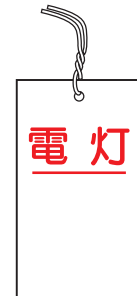
WK18 WK18(B)(無地) W40×H70×t0.5mm