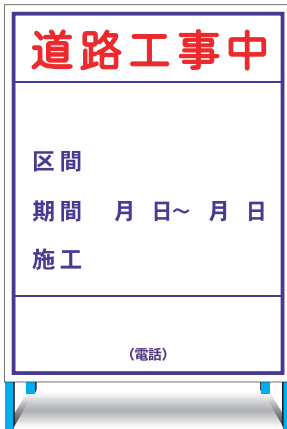
K-1(無反射) E-1(無反射) ○ W1100 × H1400mm