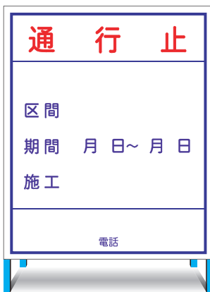
HC-20(L) (無反射) EHC-20(L) (無反射) ○ W800 × H900mm