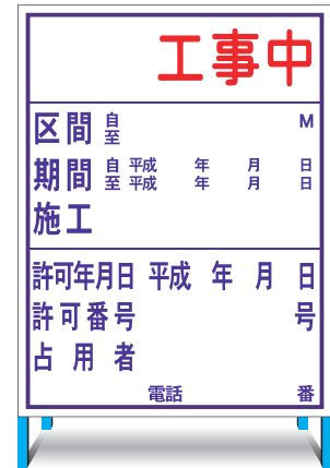
K-4(無反射) E-4(無反射) ○ W1100 × H1400mm