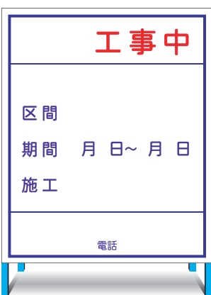
HC-22(L) (無反射) EHC-22(L) (無反射) ○ W800 × H900mm