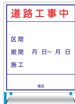
HC-21(L) (無反射) EHC-21(L) (無反射) ○ W800 × H900mm