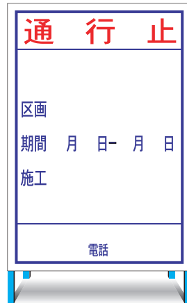
HC-20(H) (無反射) EHC-20(H) (無反射) ○ W800 × H1200mm