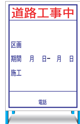
HC-21(H) (無反射) EHC-21(H) (無反射) ○ W800 × H1200mm