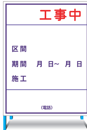
K-3(無反射) E-3(無反射) ○ W1100 × H1400mm