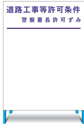
K-2(無反射) E-2(無反射) ○ W1100 × H1400mm